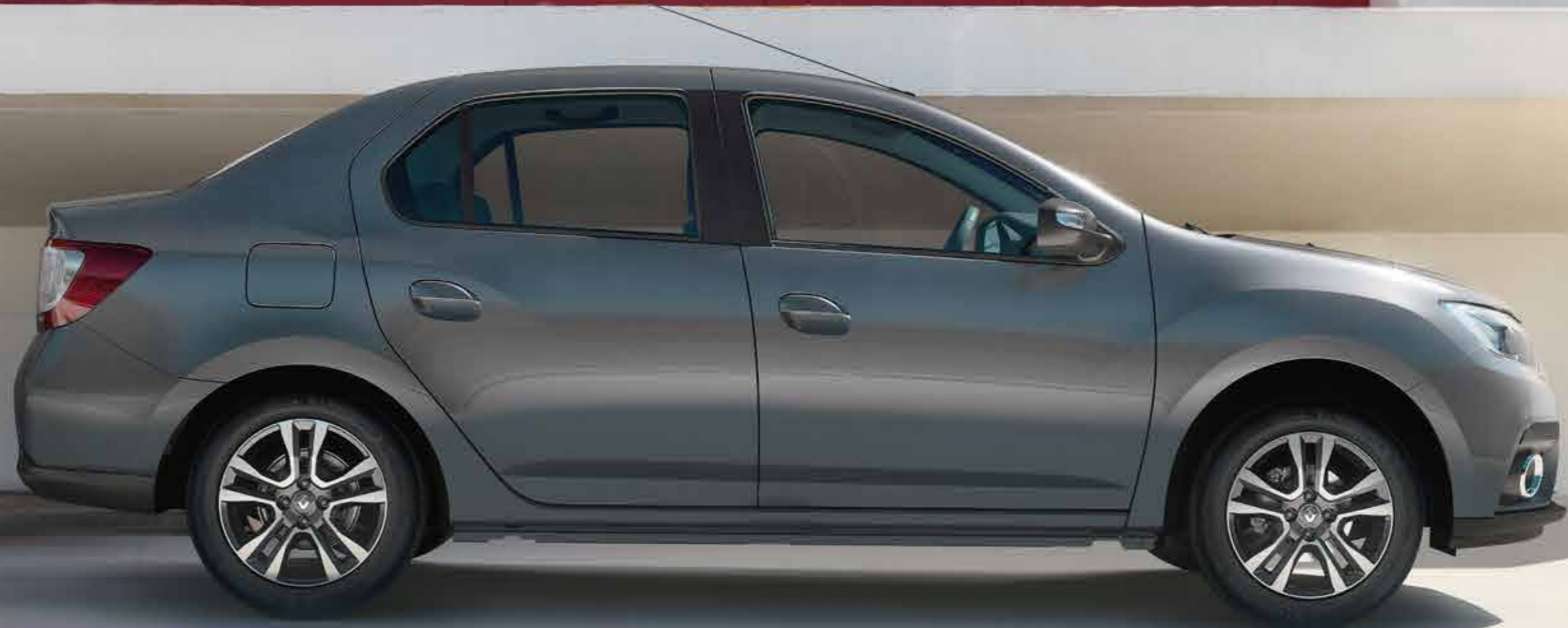
Vehículo corresponde a Renault Logan Intens modelo 2023 Las imágenes que se encuentran en este catálogo son de referencia