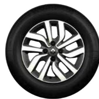
Rin de aluminio Premia 15" diamantado