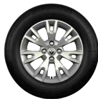
Embellecedor Eptius 15"