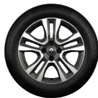
Rin de aluminio Jogger 16" diamantado